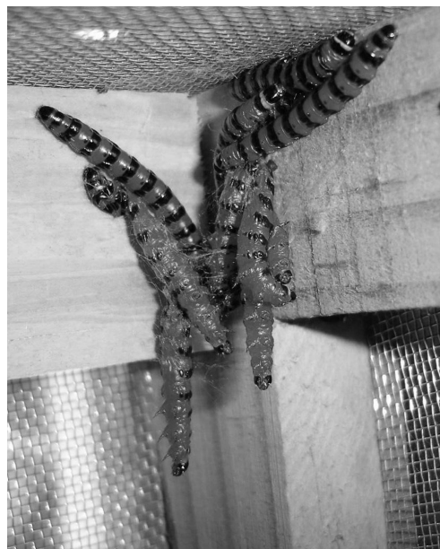
Figura 3: Larvas de C. doddi con signos de enfermedad movilizándose por el techo de la jaula.