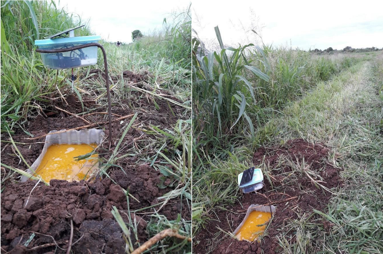
Figura 2: Trampa de atracción lumínica ubicada entre el límite del borde de plantación y el pasillo (entrebordo).