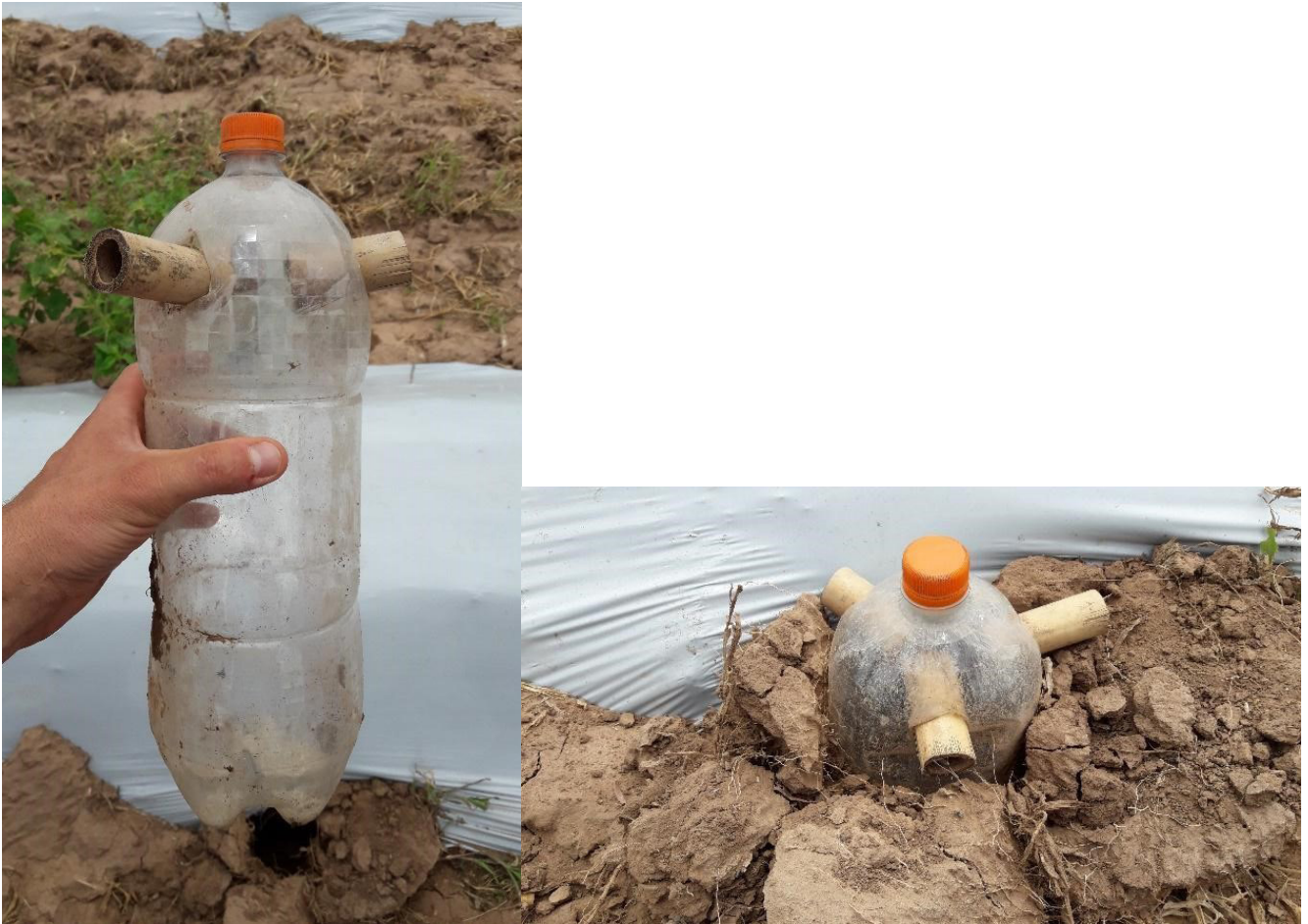
Figura 1: Trampa de atracción alimenticia ubicada entre el límite del bordo de plantación y el pasillo (entrebrodo). A. Trampa alimenticia artesanal. B. Trampa alimenticia en posición de uso.

Sin embargo, la baja captura de Gryllus sp. por las trampas de atracción alimentaria no refleja el daño que causa esta plaga en los cultivos, lo que llevó a los productores a considerar ineficiente a la trampa de atracción alimentaria como herramienta de monitoreo. En este contexto, se propone una trampa de atracción lumínica de elaboración propia.