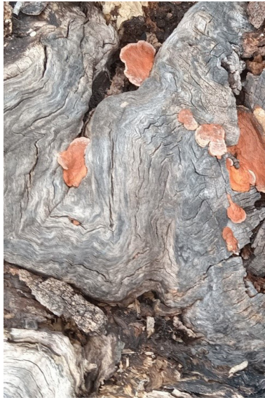
Figura 4: Carpóforos anaranjados de P. coccineus , observado en arboles muy deteriorados o en tocones de ejemplares muertos.

En las mismas condiciones que Pycnoporus , se hallaron en ejemplares de Fraxinus sp. en sitios húmedos, basidiomas gelatinosos de Auricularia sp., de color rojo amarronado, de hasta 2-6 cm de longitud, forma redondeada muy irregular, se estrecha en uno de los lados, posee curvas parecidas a una oreja, bordes ondulados (figura N°5), como fructifica en madera, sobre ramas y troncos muertos su colonización es de tipo saprofítica (Kadimova et al., 2015).