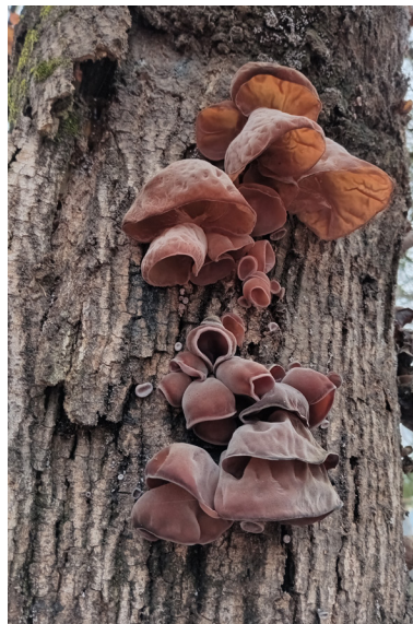
Figura 5: Basidiomas gelatinosos de Auricularia sp., sobre ejemplares de Acer sp.

En las mismas condiciones que Pycnoporus , se hallaron en ejemplares de Fraxinus sp. en sitios húmedos, basidiomas gelatinosos de Auricularia sp., de color rojo amarronado, de hasta 2-6 cm de longitud, forma redondeada muy irregular, se estrecha en uno de los lados, posee curvas parecidas a una oreja, bordes ondulados (figura N°5), como fructifica en madera, sobre ramas y troncos muertos su colonización es de tipo saprofítica (Kadimova et al., 2015).