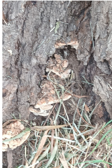
Figura 2: Daño de Fomes sp., en Salix sp., basidiocarpos desarrollados durante el otoño en el cuello de los árboles dañados.

Otros de los géneros identificados y asociado a ejemplares decadentes en el arbolado de la ciudad de San Salvador de Jujuy fue Ganoderma , y como se trata de un género que incluye saprobios o parásitos facultativos de numerosas especies (Sosa, 2009), pueden haber ingresado luego o asociado al ataque de plagas. Otro hallado frecuentemente asociado a heridas de poda o de roedores en árboles nativos fue Schizophyllum sp., un género cuyo cuerpo se asemeja a las ondas ondulantes de los corales apretados o al abanico chino suelto varían de color amarillo cremoso a blanco pálido. El sombrero es pequeño, de 1 a 4,5 cm de ancho con una textura corporal densa pero esponjosa figura N°3.