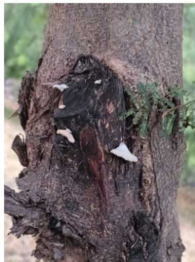
Figura 3: Schizophyllum en estado silvestre en árboles nativos del arbolado con heridas por mal manejo cultural.

Otros de los géneros identificados y asociado a ejemplares decadentes en el arbolado de la ciudad de San Salvador de Jujuy fue Ganoderma , y como se trata de un género que incluye saprobios o parásitos facultativos de numerosas especies (Sosa, 2009), pueden haber ingresado luego o asociado al ataque de plagas. Otro hallado frecuentemente asociado a heridas de poda o de roedores en árboles nativos fue Schizophyllum sp., un género cuyo cuerpo se asemeja a las ondas ondulantes de los corales apretados o al abanico chino suelto varían de color amarillo cremoso a blanco pálido. El sombrero es pequeño, de 1 a 4,5 cm de ancho con una textura corporal densa pero esponjosa figura N°3.